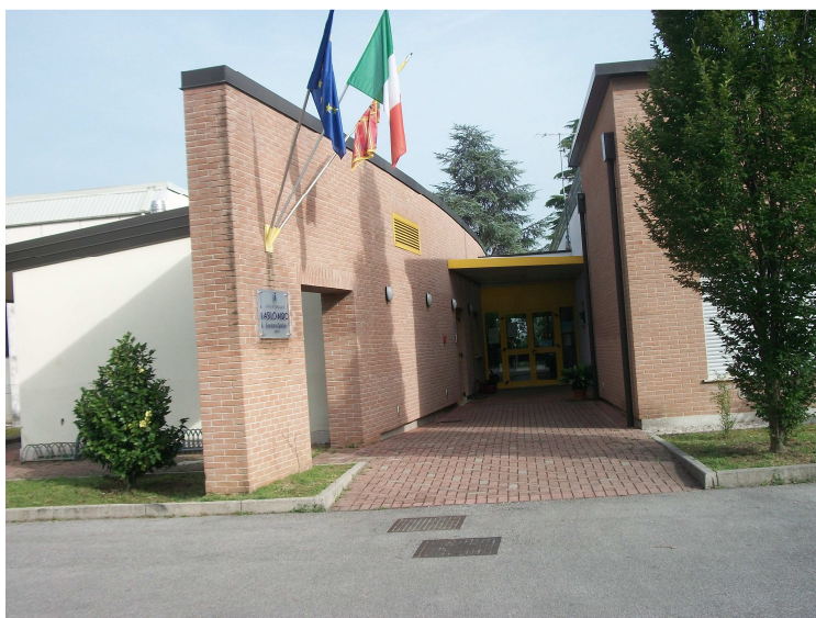
Asilo Nido "G. Zamboni"