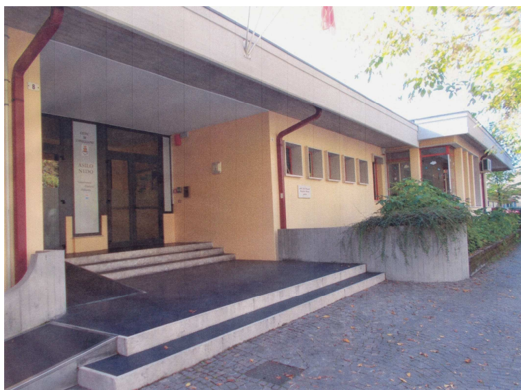
Asilo Nido "G. F. Panizza"