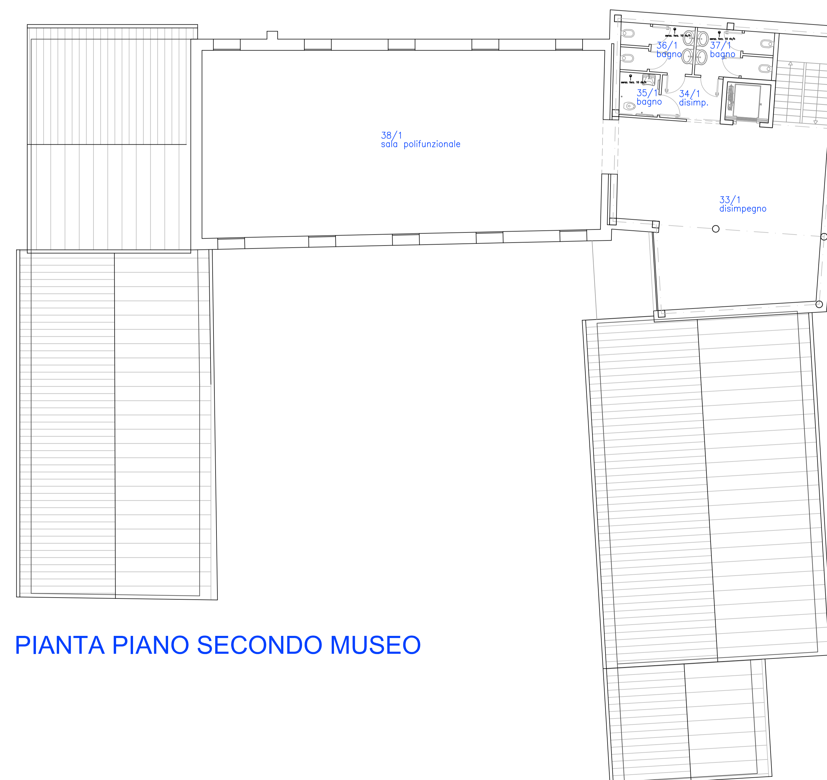
PIANTA PIANO SECONDO MUSEO