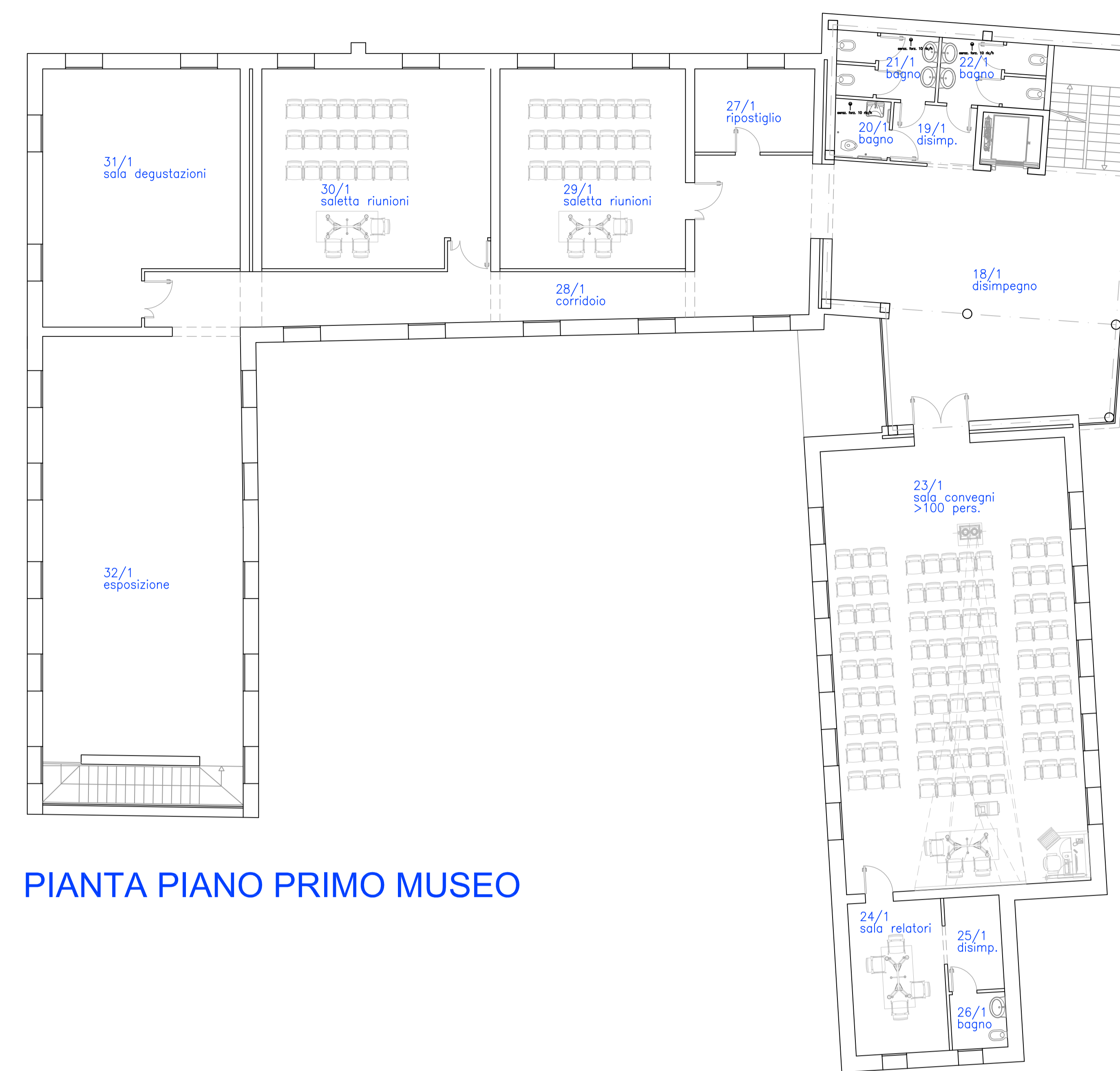
PIANTA PIANO PRIMO MUSEO