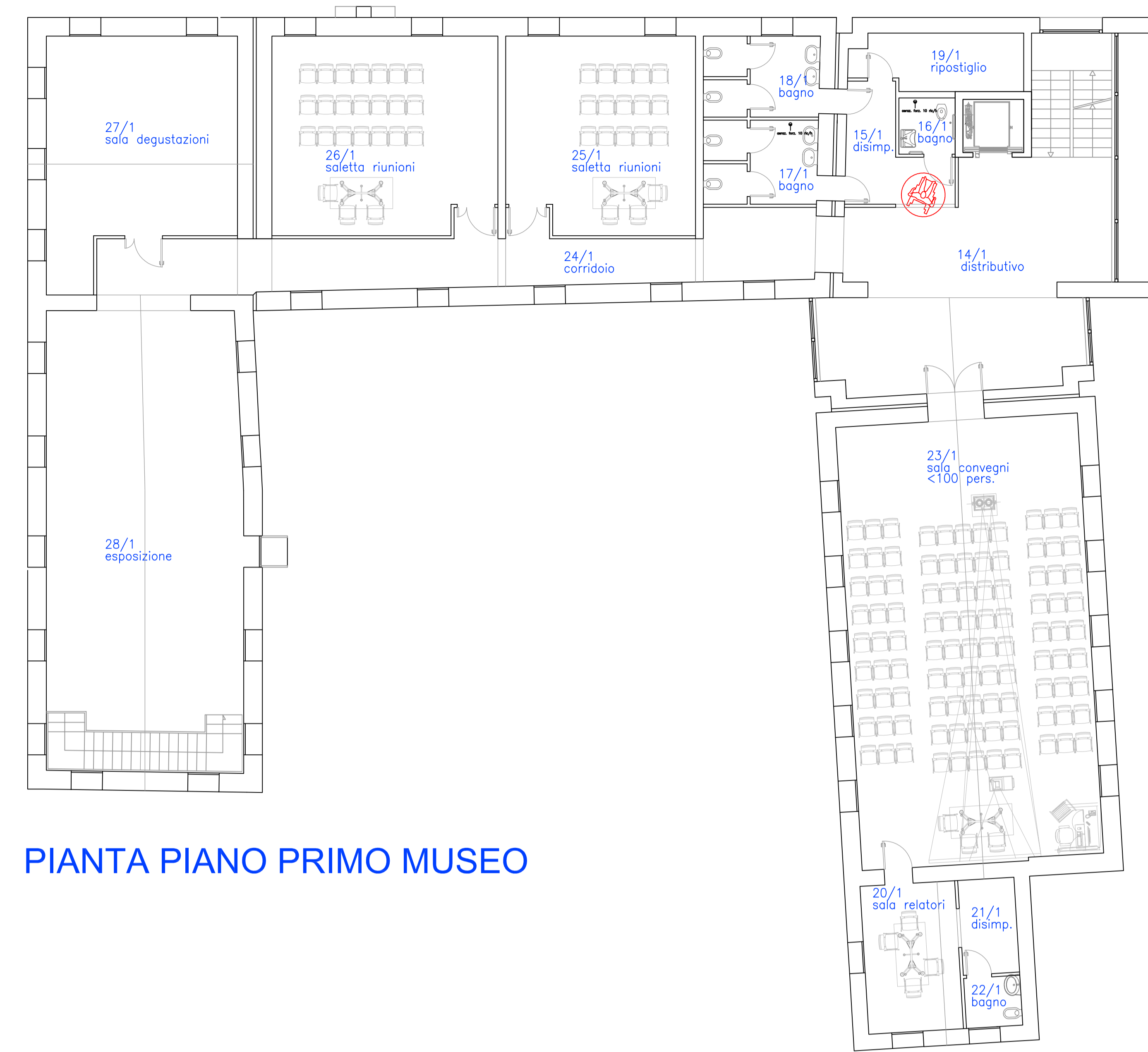
PIANTA PIANO PRIMO MUSEO