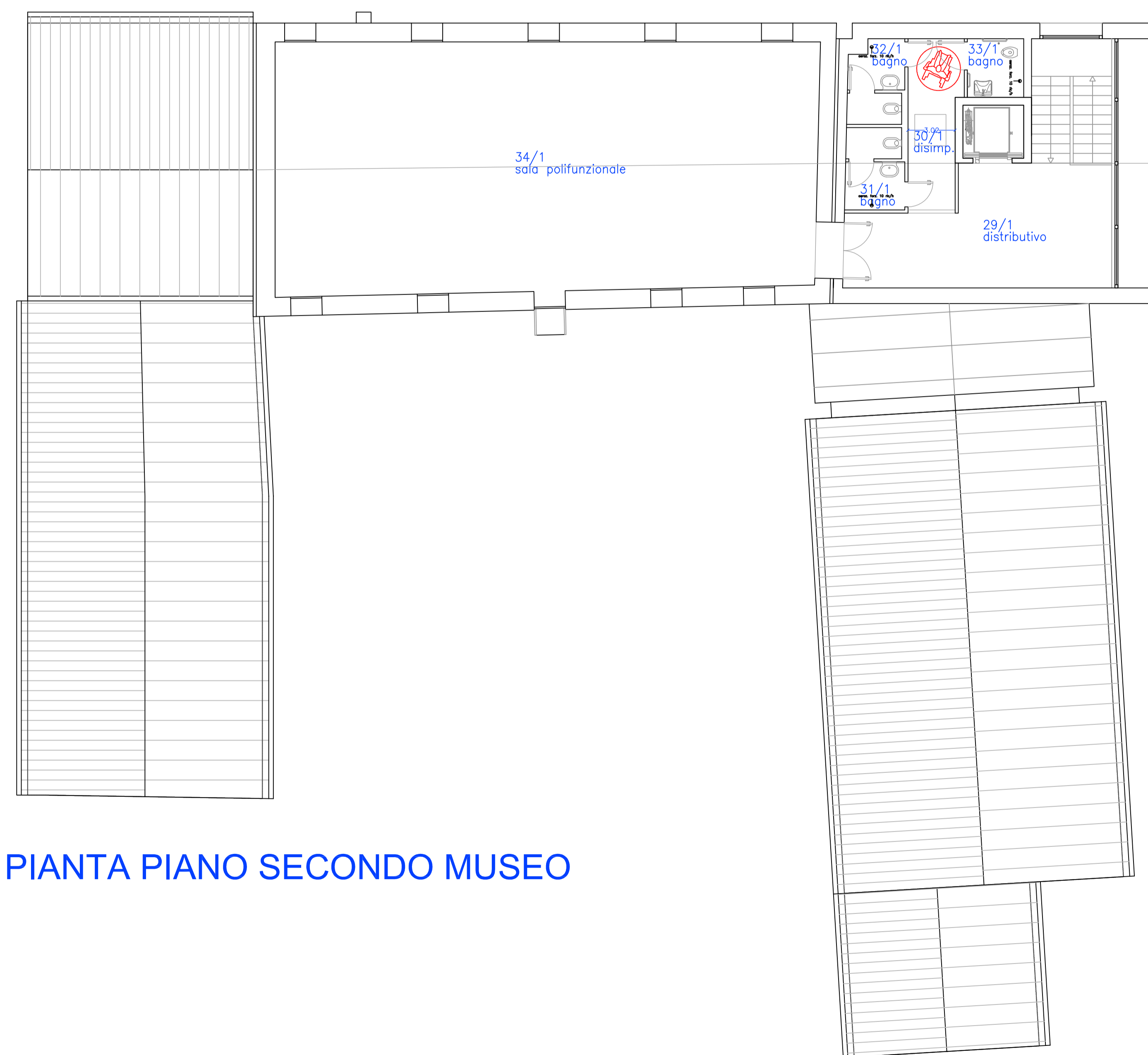
PIANTA PIANO SECONDO MUSEO