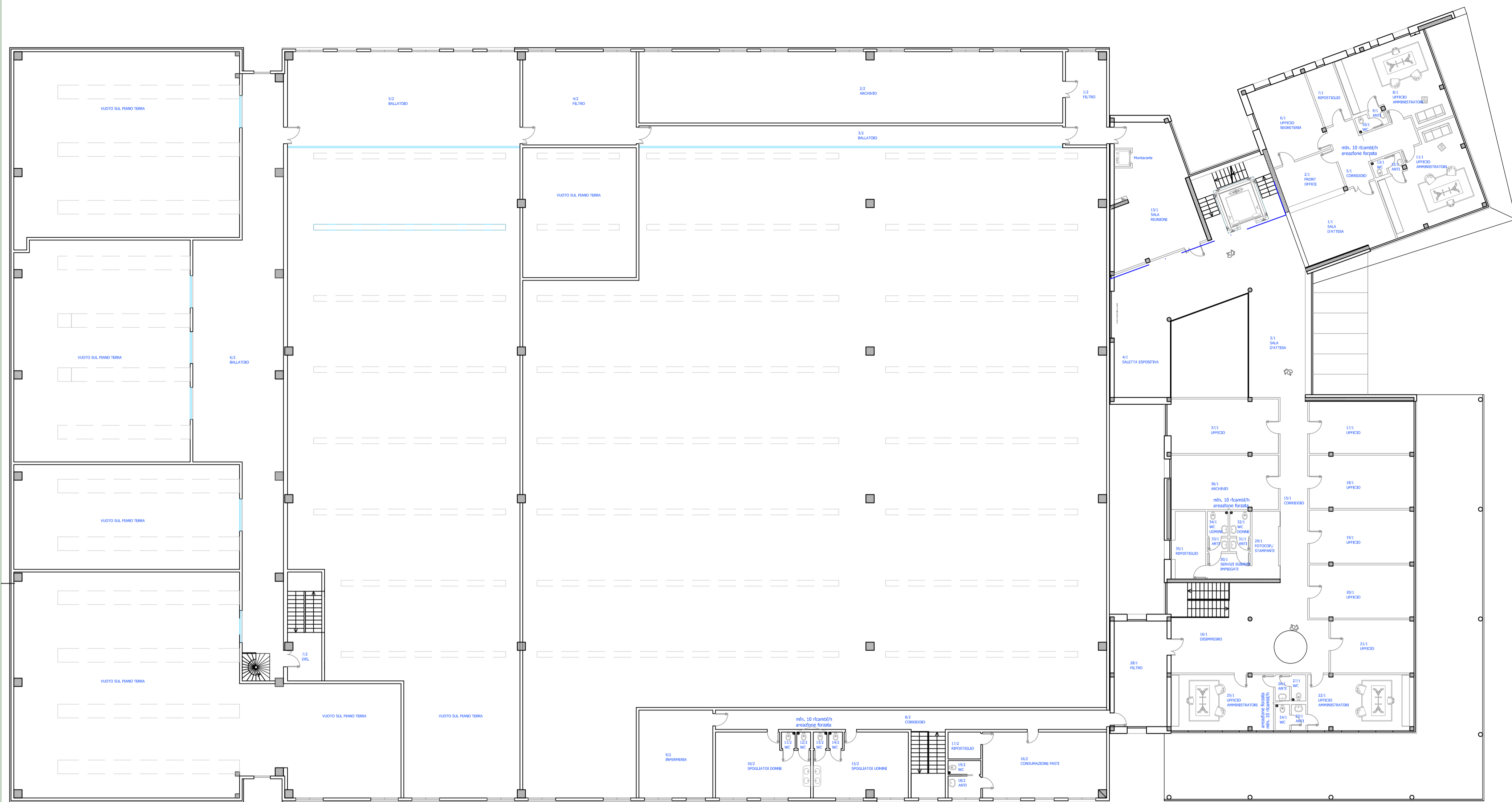
PIANTA PIANO PRIMO STABILIMENTO